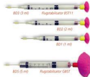
STRZYKAWKA Z IGŁĄ

Wykonane z wyjątkowej mieszanki tworzyw sztucznych gwarantują najwyższą jakość. Nie pochłaniają wilgoci, nie odkształcają się i nie wyginają. Wyjątkowo wytrzymałe i lekkie. Strzykawka w komplecie z w pełni stabilizatorem. Napełnianie strzykawek jest bardzo proste i szybkie. Strzykawki są wielokrotnego użytku i pasują do dmuchaw wszystkich producentów.