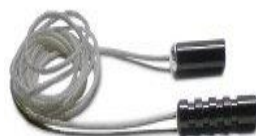
CT przyrząd do czyszczenia lufy