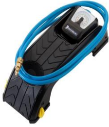
FLPM/FLP pompka nożna do aplikatorów