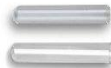
SCG nasadka na strzykawkę