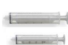
strzykawka AS ciśnieniowa