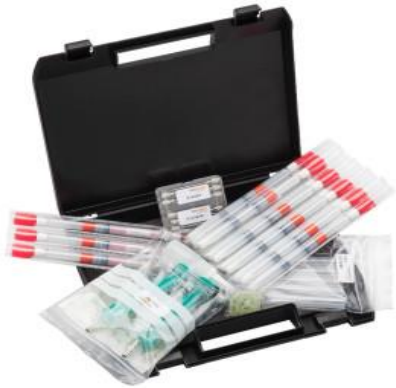
V.ZUB gr.; V.ZUB kl Zestaw startowy do aplikatora G.U.T 50