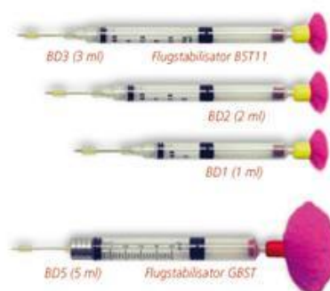
STRZYKAWKA Z IGŁĄ

Wyjątkowo lekkie. Posiadają system Luer-Lock zapewniający doskonałą szczelność strzykawki. Napełnianie strzykawk–lotek jest bardzo łatwe i szybkie. Każda strzykawka wyposażona jest w wełniany stabilizator i nasadkę ochronną. Strzykawki mogą być używane wielokrotnie. Strzykawki pasują do dmuchaw różnych producentów.