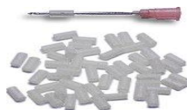
SSN50 nakładki na Igły: SSG 50 nakładki na igły: 09; 1,1;1,2 mm