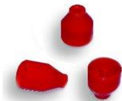
GBST 16 do B16