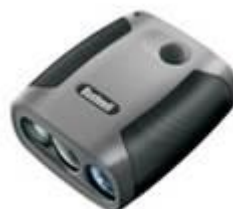
RF Dalmierz odległości. 5-915 m