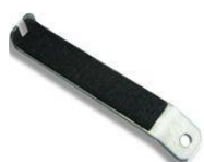
ST narzędzie do zdejmowania igły