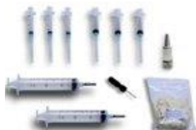
FIS zestaw do konserwacji strzykawek.