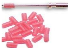
~ 50 nakładki na igły: mm