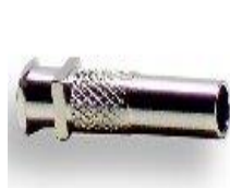
CON łącznik do AS strzykawki