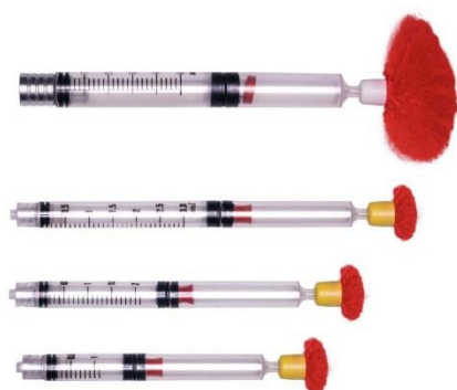
STRZYKAWKA BEZ IGŁY