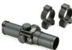
2 celownik czerwona mka