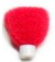
ST stabilizator do zykawk